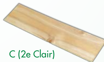
C (2e Clair)